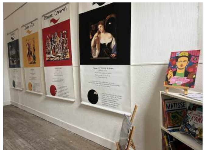
La nouvelle salle d'exposition de la médiathèque

blic de la commune en LED en partenariat avec le SDEHG et réalisés par l'entreprise Cassagne : ces travaux se prolongeront jusqu'à fin mars.