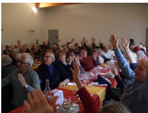
Repas des aînés au Bois perché

Adresse permanence : Maison des solidarités (à côté de la bibliothèque)