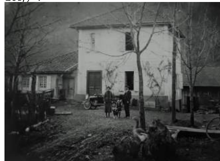
Photo du moulin Latour dans le quartier Sarradère (collection privée). ©C.Dupont

France (FDMF), association dévouée à la sauvegarde des moulins. L'article est accessible en ligne à l'adresse : https://fdmf.fr/ , rubrique « documentation-bibliographie-le monde des moulins-revue n°60 (avril 2017) ».