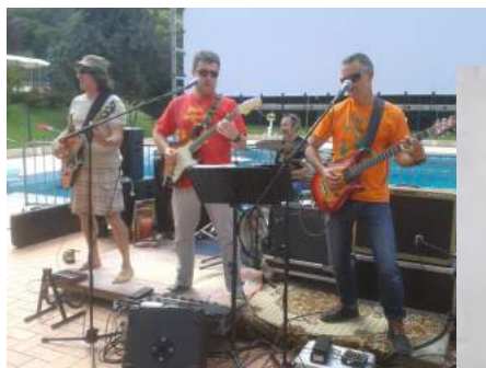
Les Bachis Bouzouks

Vendredi 27 août : 21h30, cinéma de plein air « Chacun pour tous » de Vianney Lebasque, Carré de la République